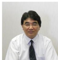
芝本雄太先生 名古屋市立大学大学院 医学研究科放射線医学分野教授